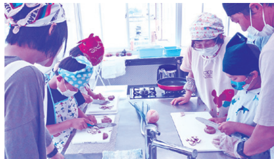
特定非営利活動法人あだたら青い空 「二本松こども食堂ハラクッチー事業」の様子