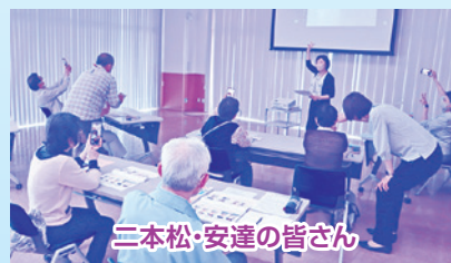
二本松・安達の皆さん

参加者のみなさんからは「親切な対応ありがとうございます。」「大変参考になりました。」「私には、難しかったです。」などのご意見をいただきました。