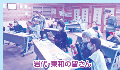
岩代・東和の皆さん