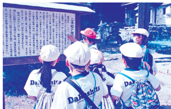
岳下小学校 「フィールドワークの様子」