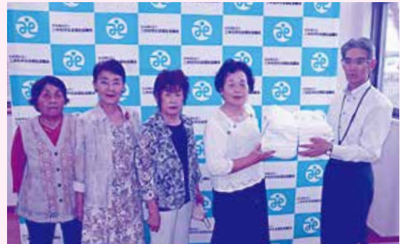
二本松方部あだたらクラブ女性部 様