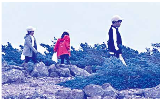
ゴミを拾いながら登る子どもたち