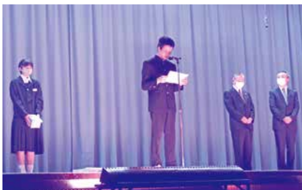
二本松第二中学校

二本松第二中学校と岩代中学校では、長年にわたり全校をあげてのアルミ缶回収活動を行っており、今年度もその益金を活用し、市社会福祉協議会と市内の高齢者施設・福祉施設に福祉用具等の寄贈を行いました。