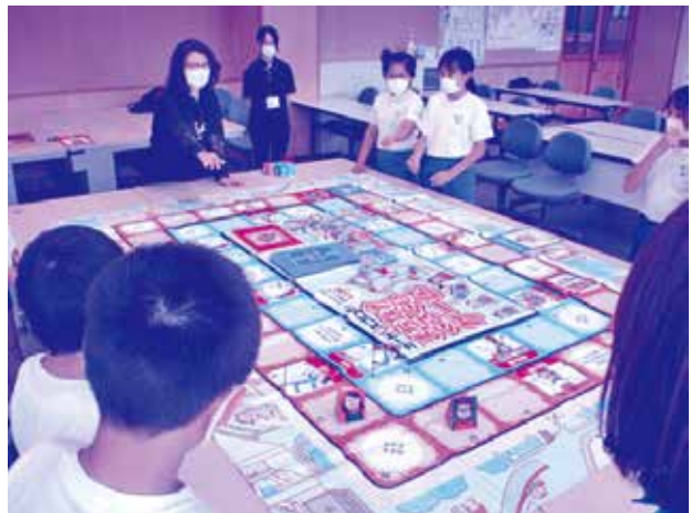
ユニバーサルデザイン体験

子供たちは、UDを楽しく学ぶことができる「UDすごろく」を体験しながら、高齢者、障がい者、車いすの人、妊娠している人など様々な役柄になり、「お年寄りが階段の場所にいたらどうするか」「車いすの人が段差のある場所にいたらどうするか」などの場面を想像しながら、自分たちができるUD社会について考えました。