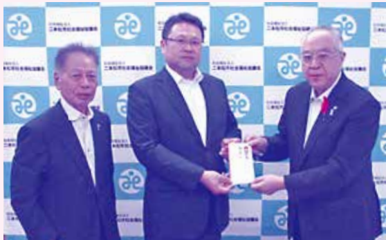
福島県宅地建物取引業協会安達支部 様