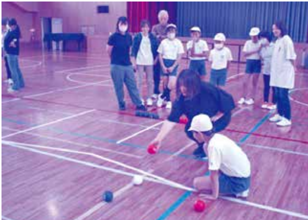
親子ボッチャ教室

今年の夏に開催されたパリ・パラリンピックで県内出身選手がメダルを獲得した「ボッチャ」。