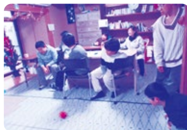
やんわりハートⅡ (クリスマス会事業)

市内で障がい児(者)・子育ての支援活動をしている福祉施設・団体等を対象に年々開始行事の開催に対する支援を行いました。(23施設・団体)