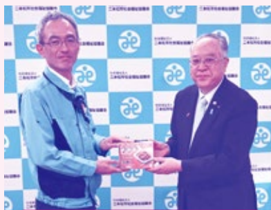
東北電力ネットワーク株式会社 様