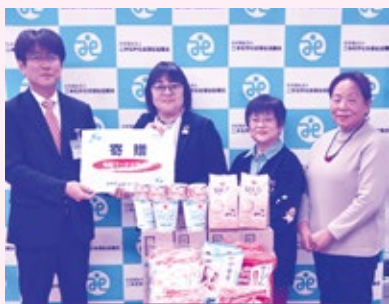
みやぎ生協コープふくしま 様